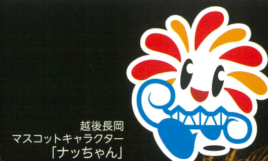
越後長岡 マスコットキャラクター 「ナツちゃん」